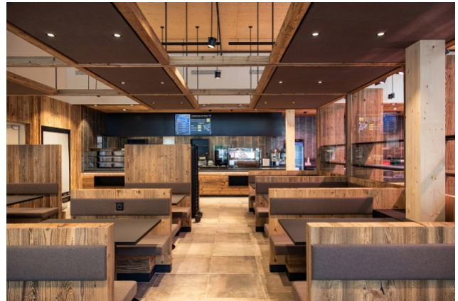
Innenbereich der Gastrostube