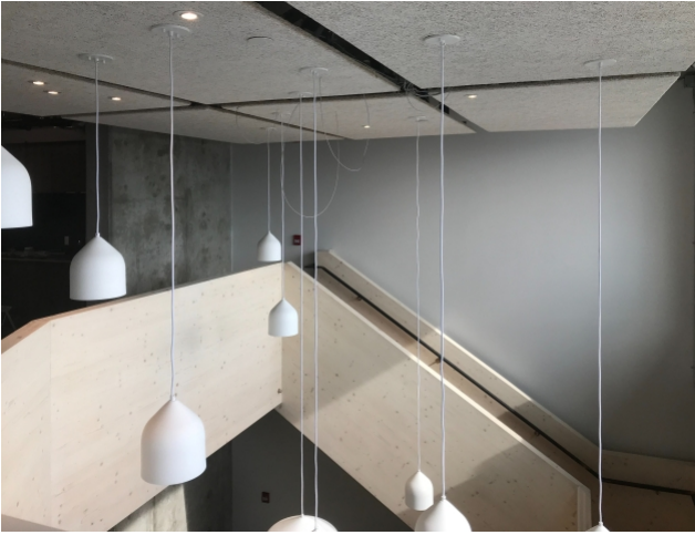
Die erste Treppe mit der TS3-Technologie