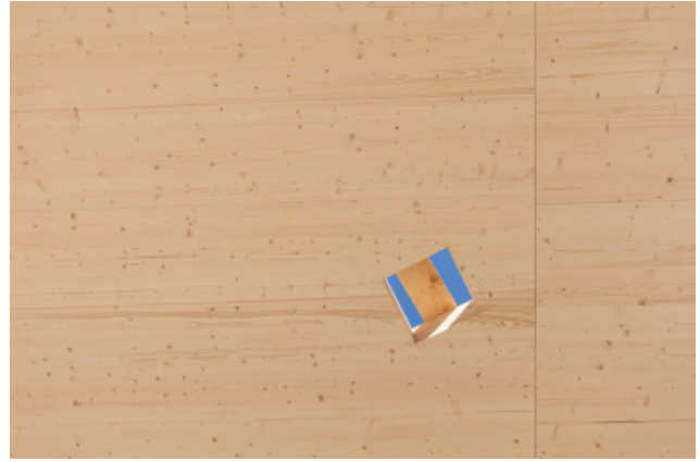
Vergessene TS3-Fuge.