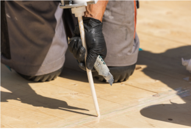
Verklebung einer TS3-Fuge.